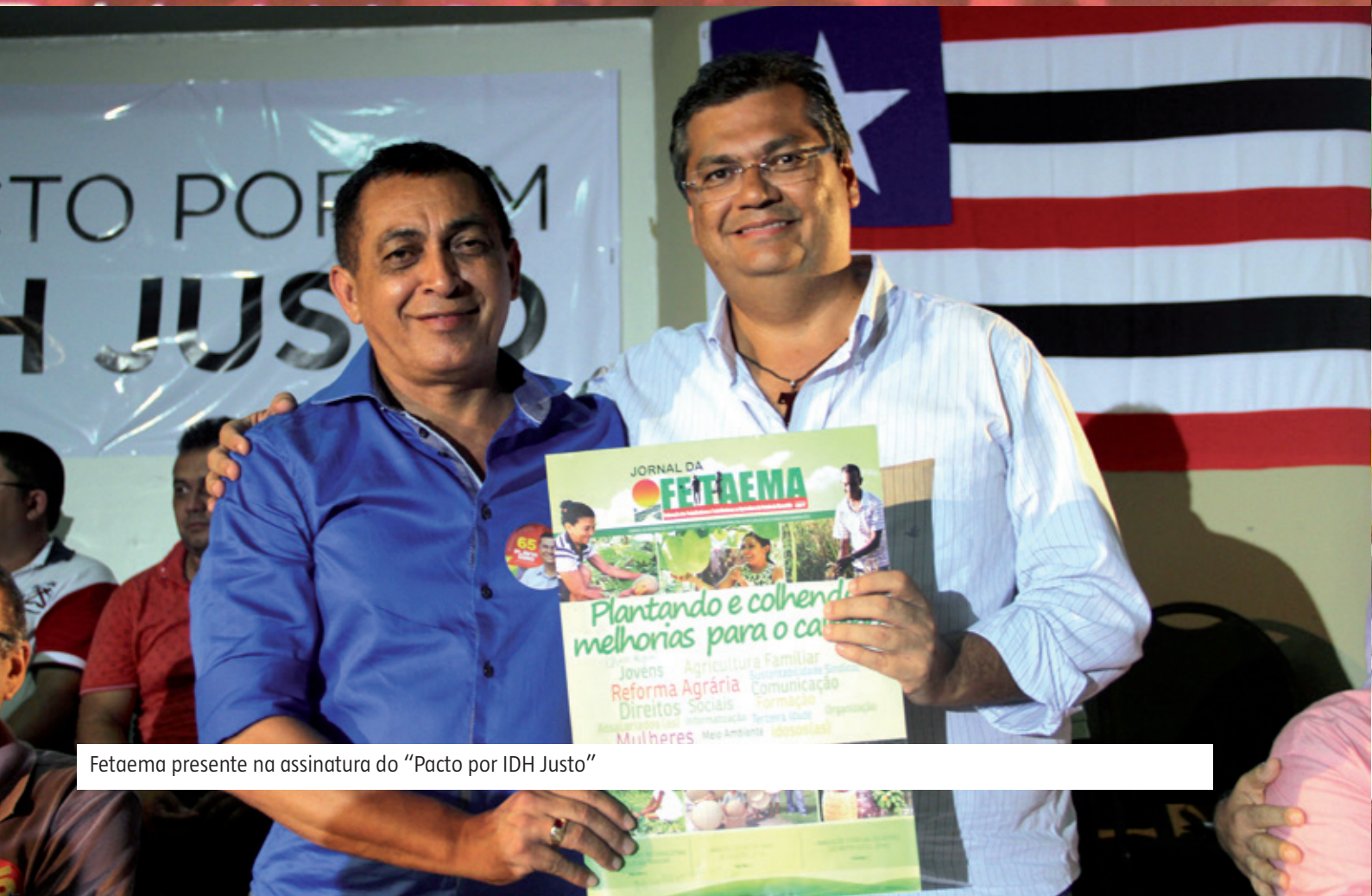
Fetaema presente na assinatura do "Pacto por IDH Justo"