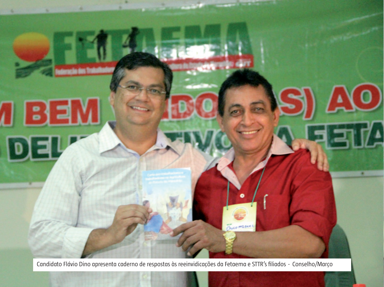
Candidato Flávio Dino apresenta caderno de respostas às reivindicações da Fetaema e STTR's filiados - Conselho/Março