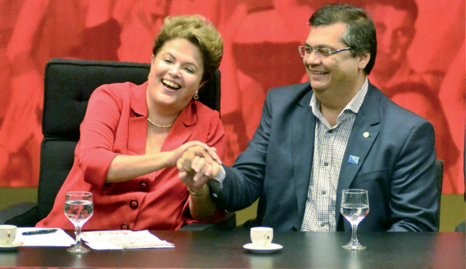
Candidatos apoiados pela Fetaema e Sindicatos filiados Dilma Rousseff e Flávio Dino nas eleições de 2014