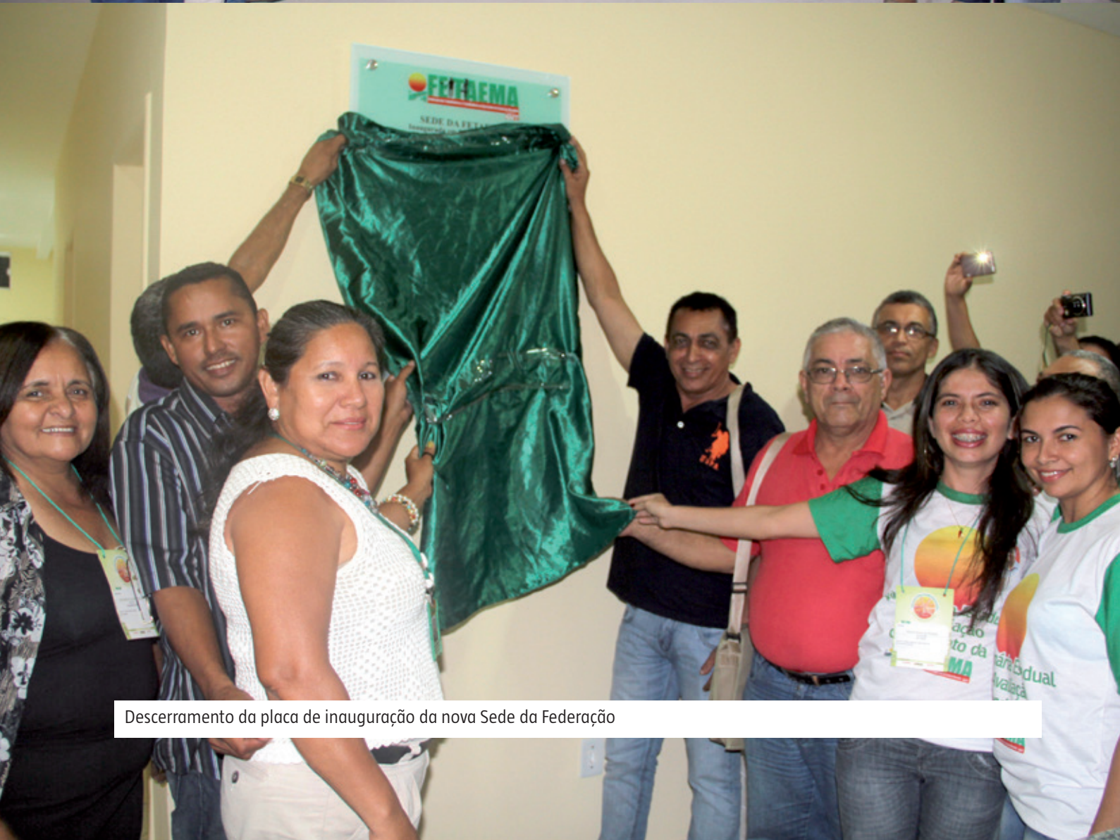
Descerramento da placa de inauguração da nova Sede da Federação