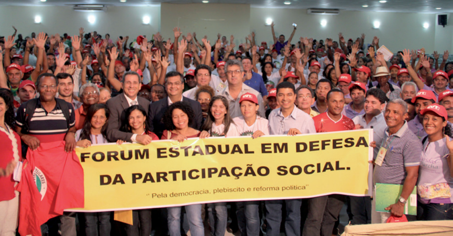
Plenária do Conselho Deliberativo / Dezembro