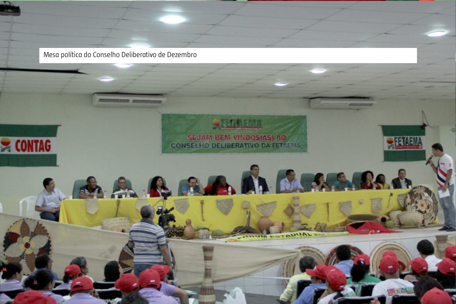
Mesa política do Conselho Deliberativo de Dezembro